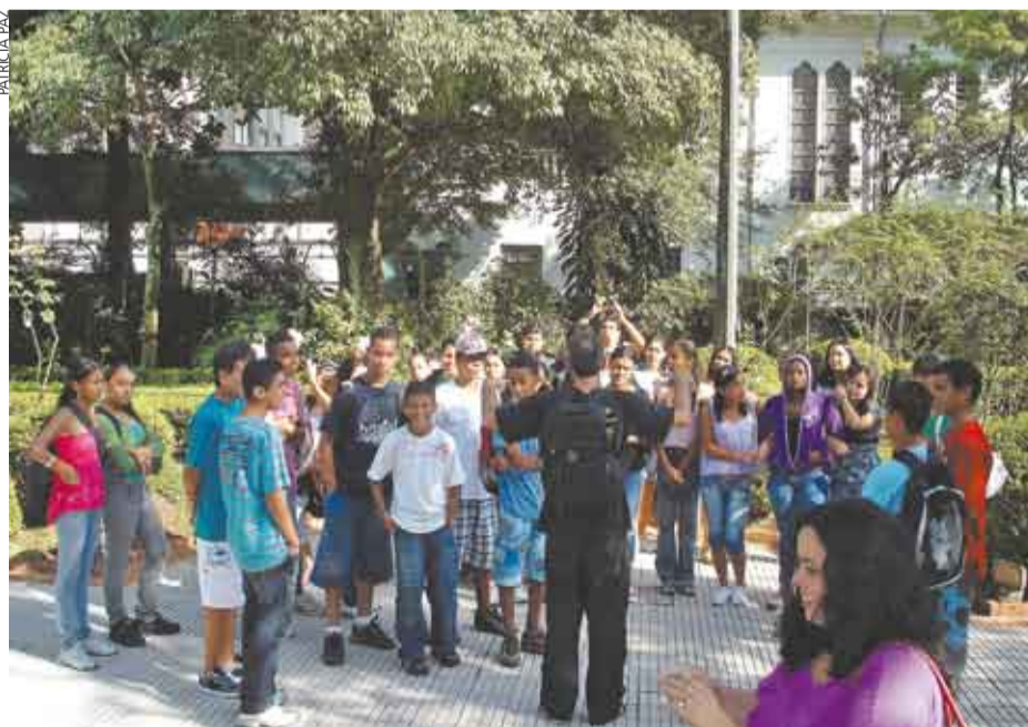
Estudantes do 8º ano da Escola Prof. Enzo Antonio Silvestrin em visita à Casa das Rosas